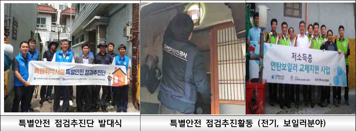
특별안전 점검추진단 발대식