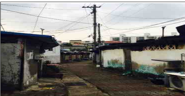
< 대구 서구 쪽방촌 >