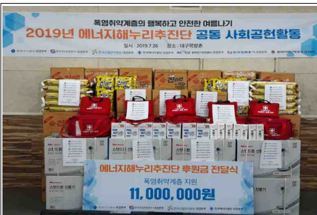
폭염취약계층 후원물품 전달