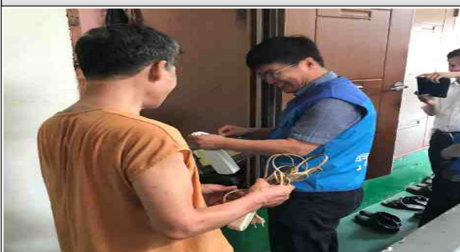
쪽방촌 물품 전달