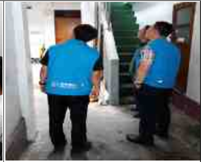
< 쪽방촌 실태점검 >