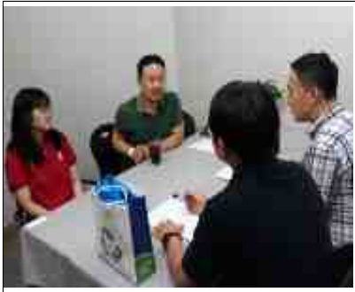
< 쪽방상담소 의견청취 >